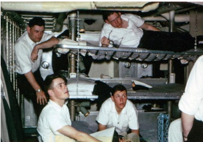
8 Mess – Prestonian Class Frigate 1961 Punka louvres – pas de climatisation

Notre programme se concentrera sur la commémoration du centenaire de la Réserve navale et les réalisations de ses membres actuels et passés, y compris ceux qui ont participé à ses divers programmes de formation d'officiers de l' UNTD au ROUTP , NROC et RESO et au-delà.